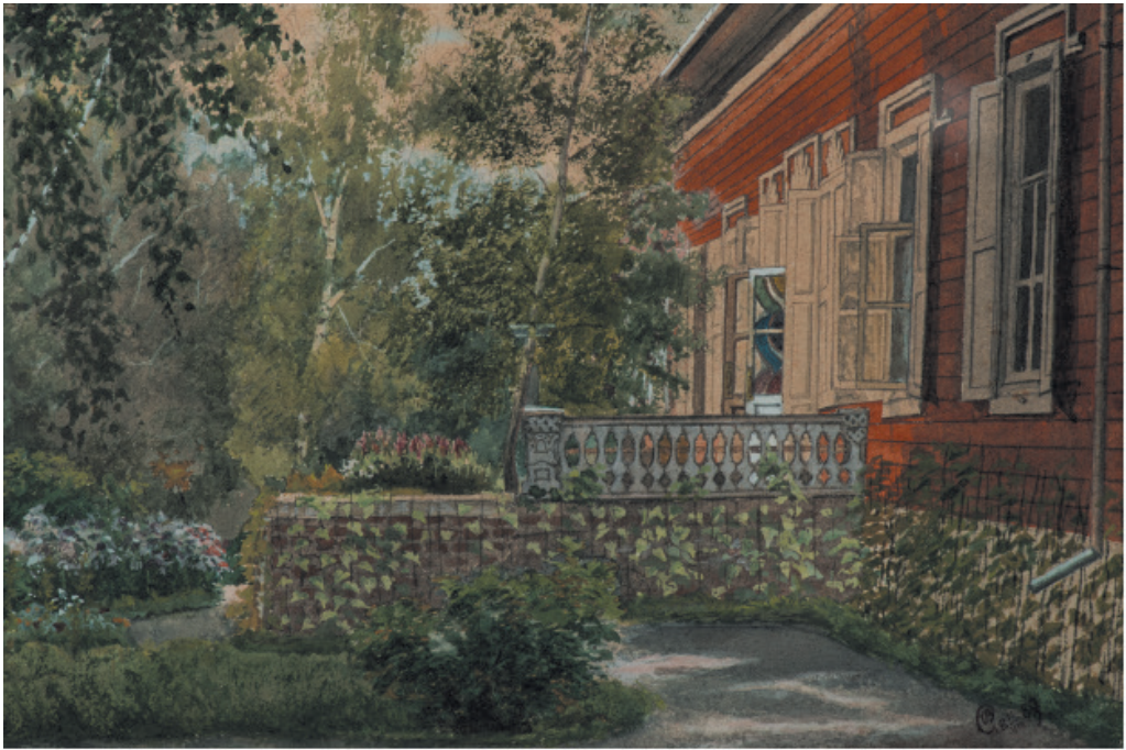
Имение «Гремячка». 1899.» бумага, акварель. 24x16. Инв. #93.